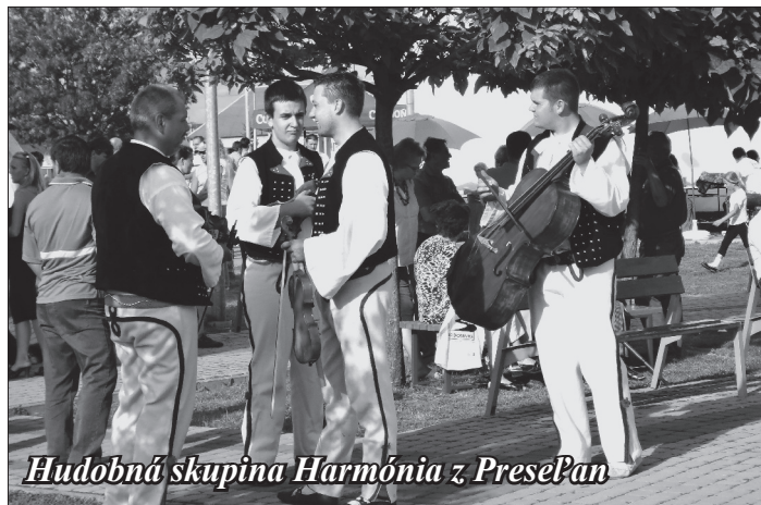
Hudobná skupina Harmónia z PresePan