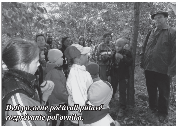
Deťi pozorne počúvali pútavé rozprávanie poľovníka.