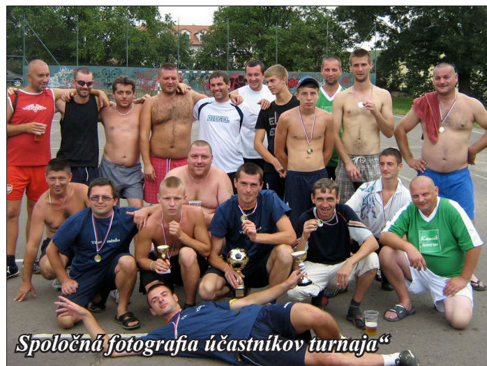
Spoločná fotografia účastníkov turnaja