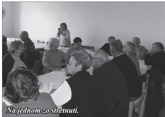
Na jednom zo stretnutí.

V tomto roku sme pracovali v počte 79 členov. S niektorými sme sa žiaľ, museli navždy rozlúčiť, zároveň sme získali nových členov, ktorí sa rozhodli k nám pripojiť. Niektorí seniori sa pravidelne stretávajú v klube dôchodcov na spoločných posedeniach a rôznych prednáškach. Tak sme zorganizovali 20. januára aj zdravotnú prednášku na tému „Alzheimerova choroba vo vyššom veku“, ktorú si pripravila predsedníčka organizácie. Na ďalšej spoločnej akcii v klube dôchodcov nám boli prezentované zdravotné príkrývky, vankúše, matrace a liečivé masti. V klube sme sa stretli aj 1. júla, kde sme potrebovali informovať svojich členov o petičnej akcii proti rušeniu valorizácie dôchodkov v nasledujúcich rokoch a o rekondičných pobytoch v kúpeľoch. Členky výboru vyzbierali v obci 240 podpisov od seniorov a ich rodinných príslušníkov.