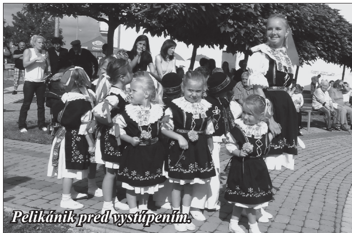
Pelikánik pred vystúpením.