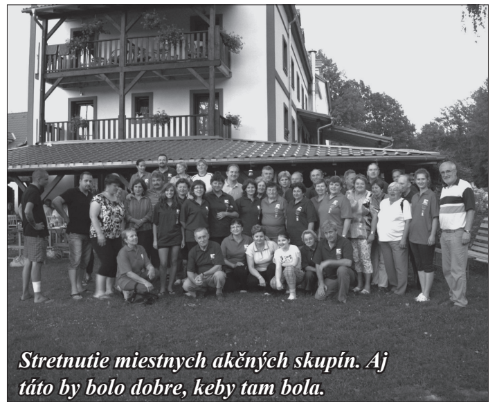
Stretnutie miestnych akčných skupín. Aj táto by bolo dobre, keby tam bola.

Celodenný program sme uzavreli návštevou kláštora „Nové